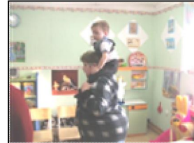
Малыш и Карлсон