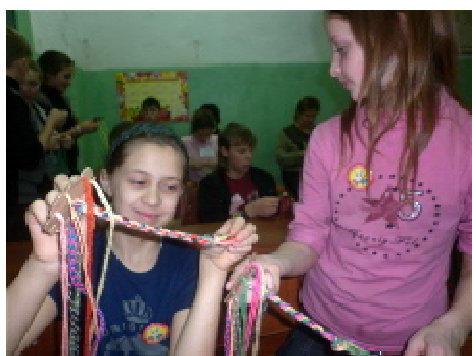
Мастер-класс по плетению пояса-оберега—покровки