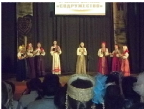
Ансамбль «Бассенько» на сцене фестиваля «Содружество»

Фольклорный ансамбль «Бассенько» существует с 1997 года и за 15 лет, реконструировал много русских песен, обрядов. Сейчас в ансамбле занимается 40 ребят в трех возрастных группах. В 2003 году губернатор Пермского края Ю.Трутнев вручил «Бассенько» премию в сфере культуры и искусства за спектакль «Легенды Чердынской земли». А потом были выиграны конкурсы с 6-ти часовым спектаклем «Чердынская свадьба», записи на музыкальный диск и много, много разных фестивалей, конкурсов и концертов. В 2008 году было присвоено самодеятельному коллективу самое высокое звание «Образцовый детский фольклор-