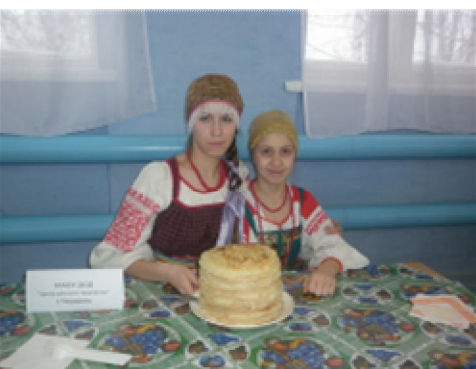
Участницы ансамбля представляют русское национальное блюдо «Колобы»

- Такой фестиваль стоит проводить. Он приобщает нас, молодых, к своей культуре и знакомит с культурами других народов, учит быть терпимыми и понимать их . Нас так много: русских, татар, башкир, коми; белых, красных, черных; светлорусых, темноволосых, рыжих, и это всё—наша Россия. Я поняла, что значит для каждого из участника фестиваля любить свою Родину, ценить, уважать и не забывать свои корни. Мы и есть корни своей страны!